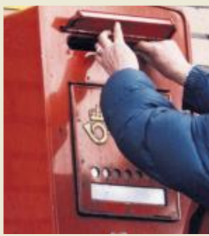
Posten skal frem. Nye postnummer skal gjøre det lettere.

26 STEDER FÅR NYE POSTNUMRE ■ 26 større tettsteder og mindre byer blir 1. oktober i år delt inn i flere postnumre. Posten innfører flere postnumre for de 26 stedene for å oppnå bedre og mer effektiv sortering og distribusjon av brev og pakker. – Større byer i Norge har alt en inndeling med bruk av flere postnumre. Nå har befolkningsveksten gjort det nødvendig med mer detaljert inndeling flere steder, opplyser Posten. Postens beregninger viser at 108.000 husstander og 12.000 virksomheter kan bli berørt av endringene. En del av disse vil likevel beholde dagens postnumre. Den endelige inndelingen skal være klar 1. juni.